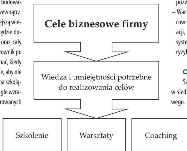
Rysunek: Kolejne kroki przy planowaniu rozwoju pracowników

potrzebne, aby tam być. W ten prosty sposób ustalimy wiedzę i umiejętności, jakie powinniśmy rozwijać u pracowników. Kolejny etap, to wybór odpowiedniego programu szkoleniowego. Skoro kierunki rozwoju pracowników mają wynikać z celów biznesowych organizacji, to program szkolenia nie może być „szkoleniem z półki”, czyli np. standardowym szkoleniem z „technik sprzedaży”, realizowanym w tej samej formule dla wszystkich. Szkolenie musi odpowiadać na rzeczywiste potrzeby, a nie tylko być dopasowane do branży. Aby rozpoznać rzeczywiste potrzeby szkoleniowe, należy oprzeć projektowanie na diagnozie organizacji, związanej z rozpoznaniem istniejących względem postawionego celu biznesowego luk kompetencyjnych i rekomendowaniem odpowiedniej formy wsparcia.